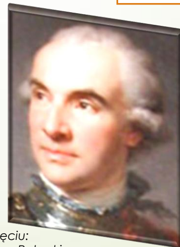
Na zdjęciu: Szczęsny Potocki