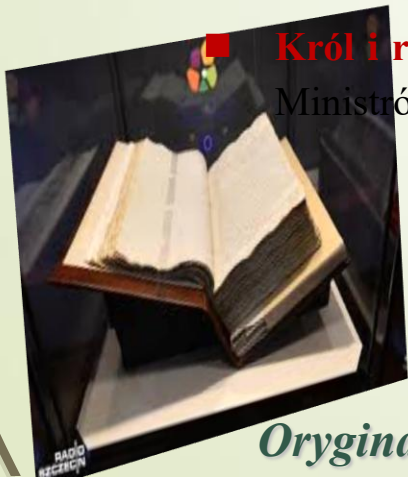
Oryginalny rękopis Konstytucji 3 maja