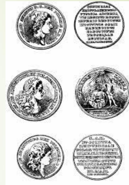
Medale wybite z okazji uchwalenia Konstytucji 3 maja

Przyjęcie Konstytucji 3 maja spowodowało wrogość sąsiadów Rzeczypospolitej Obojga Narodów. Polska zaradzona przez swojego pruskiego sprzymierzeńca, Fryderyka Wilhelma II, została pokonana przez Imperium Rosyjskie. Po utracie niepodległości w 1795 roku, przez 123 lata, Konstytucja 3 maja przypominała o walce o niepodległość. Zdaniem dwóch jej współautorów, Ignacego Potockiego i Hugona Kołłątaja, była „ostatnią wolą i testamentem gasnącej Ojczyzny”.