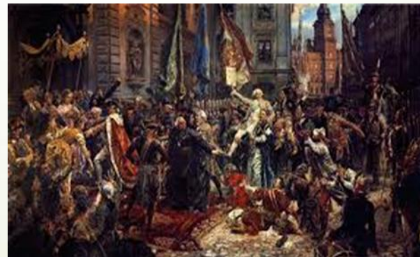
Konstytucja 3 maja 1791 obraz Jana Matejki